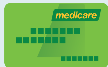
Kadi ya Medicare

Ukifika Australia, utatumiwa kadi ya Medicare.