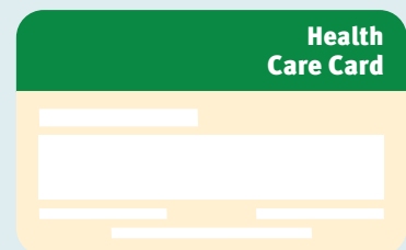
Kadi ya Huduma ya Afya

Kadi ya Huduma ya Afya ni ya watu wenye kipato cha chini na inaweza kukusaidia kupata baadhi ya huduma za afya na kupata baadhi ya dawa ulizoandikiwa na daktari kwa bei nafuu. Kawaida, kadi hii haisaidii kwa gharama za vitamini na virutubisho.