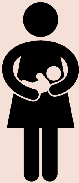
ကလေးမွေးဖွားပြီးသောအချိန်